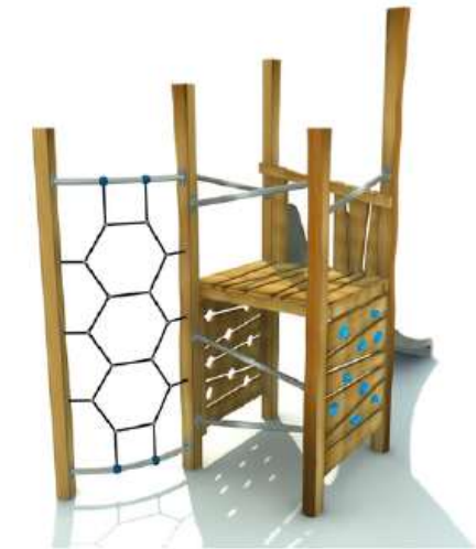
Vizualizace mají informativní charakter.